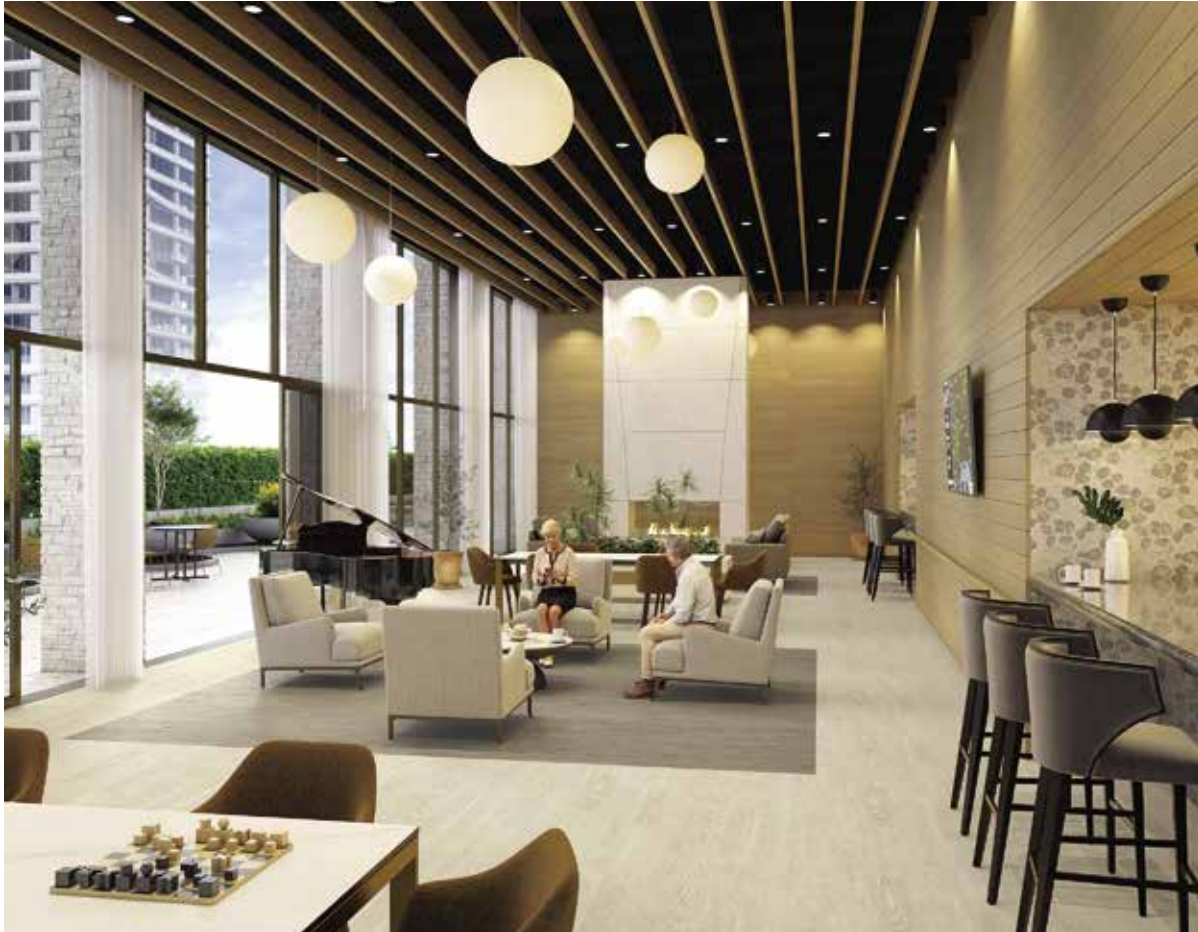
Brittnau Oak : 80870 Palo Santo, 80873 Cèdre

Brittnau Oak MC est disponible en 10 coloris allant de tons clairs et légers à des tons foncés et de noix. Brittnau Oak présente un assortiment de motifs simples avec des yeux de bœuf et des visuels à grain faible à moyen.