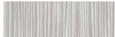
ST895 Atro, Poussière argentée