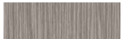
ST892 Atro, Ravenne