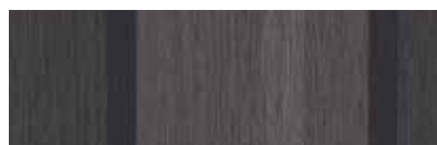
ST851 Decima, Tweed