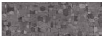
ST835 Geome, Obsidienne