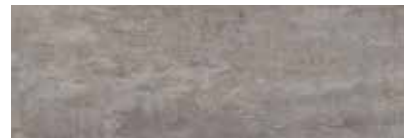
ST885 Oxidize, Uranium