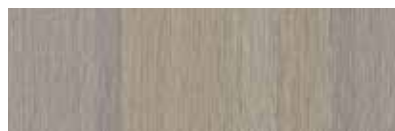
ST852 Decima, Ravenne