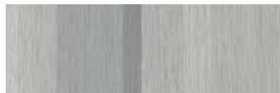
ST856 Decima, Cachemire