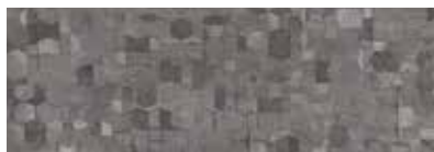
ST834 Geome, Ardoise