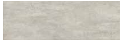
ST884 Oxidize, Rhodium