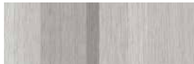
ST855 Decima, Poussière argentée