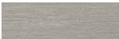
ST776 Nona, Ravenne