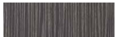
ST891 Atro, Tweed