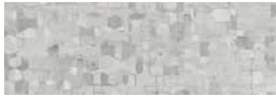
ST830 Geome, Calcite

Inspiré des techniques artisanales de la mosaïque, Geome présente un motif géométrique avec des changements de couleur subtils et Oxidize a un aspect de métal anodisé, similaire à la céramique émaillée. Les deux modèles sont disponibles en carreaux de 457 mm x 914 mm (18 po x 36 po).