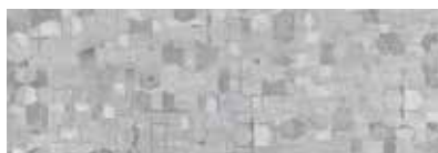
ST833 Geome, Azur