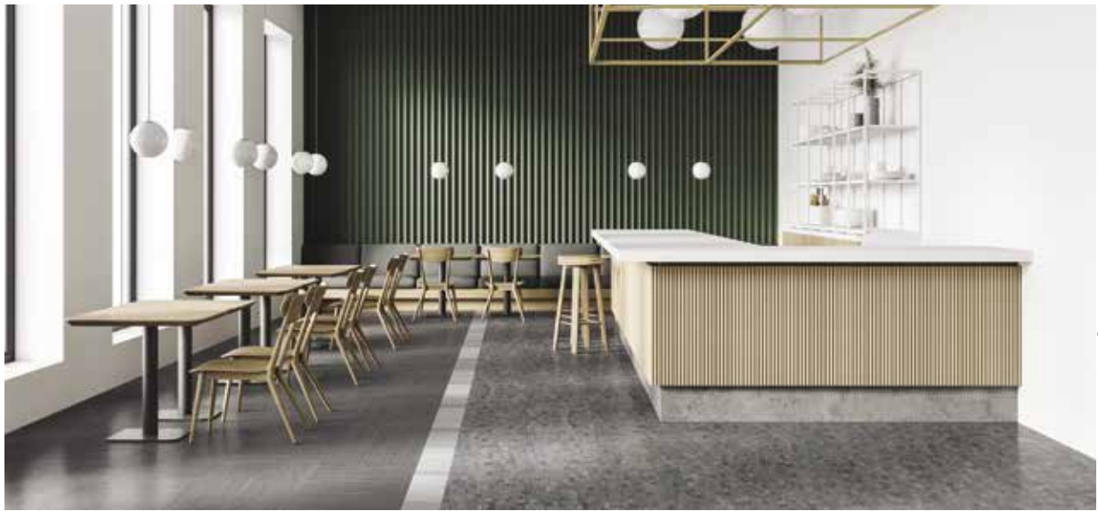
ST796 Nona, Tweed | ST855 Decima, Poussière argentée | ST894 Atro, Ardoise

Nona, Decima et Atro ont été conçus comme une trinité, chacun avec une texture unique mais unifiée représentée dans des couleurs neutres. Utilisez-les ensemble ou indépendamment pour créer un espace unique.