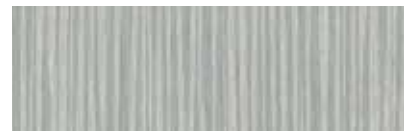
ST896 Atro, Cachemire