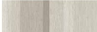
ST854 Decima, Valérie