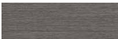
ST796 Nona, Tweed