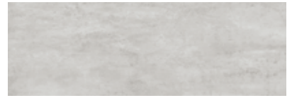
ST883 Oxidize, Platine