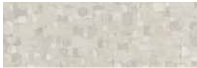
ST831 Geome, Sulphure