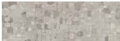
ST832 Geome, Dolomie