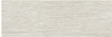
ST797 Nona, Valérie

Nona et Atro sont disponibles en carreaux de 457 mm x 457 mm (18 po x 18 po) et Decima en planches de 152 mm x 914 mm (6 po x 36 po).